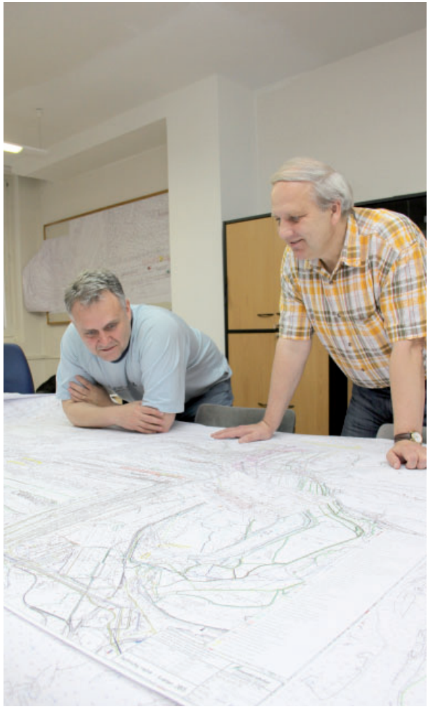
Spoustu času stráví přípraváři nad důlními mapami, ovšem velkou část své pracovní doby se pohybují přímo v provozu.

období od dvou až po deset let. V něm už se jde mnohem více do hloubky a po každém roce provozu lomu se data ještě upřeshňují. V těchto záležitostech spolupracujeme i s celou řadou vnitřních útvarů společnosti i dalšími institucemi, báňskými projekty nebo výzkumnými ústavmi,“ vysvětlil Knotek. Většina zaměstnanců se s prací přípravářů setkává až ve chvíli, kdy začínají střednědobé plány rozpracovávat skutečně dopodrobna na jednotlivé měsíce i dny. „Ve Vršanské uhelné máme přípraváře pro skrývkou a pro uhlí. Vždy na podzim, právě na základě střednědobého plánu zpracují důlní plánovací mapy. To je vlastně takový roční plán šachty, kterého se v následujícím roce všichni drží. Obsahuje jak postupy velkостrojů, tak výši těžeb, které se samozřejmě musí konzultovat i s výrobou a odbytem. A jde nejen o množství, ale také o kvalitu uhlí. Všechny činnosti jsou rozpracovány na každý jednotlivý měsíc,“ přiblížil Tomáš Knotek. Nesmí se přitom zapomenout na generální opravy, odstávky, přestavby dopravníků, ale také třeba kolejovou dopravu. Každý den v provozu „V rámci měsíčních technických režimů doslova pítváme jednotlivé skrývkové i uhelné řezy, ale tentokrát až do jednotlivých dnů. Musíme se přitom držet důlních map, ale také požadavků zákazníků na kvalitu a množství uhlí. A zohlednit se musí i taková specifika, ja-