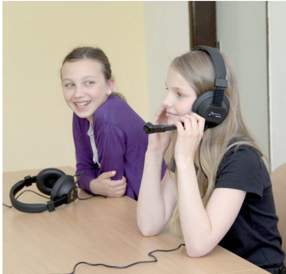
Speciální sluchátka mají dětem mimo jiné pomoci překonat ostych z komunikace před ostatními.

vali tak, aby ji využili všichni žáci školy při výuce obou jazyků, které u nás vyučujeme, tedy angličtiny i němčiny. Výhodou je i fakt, že se dá vybavení do budoucna ještě rozšiřovat, například o počítačovou techniku,“ doplnil ředitel. Základní škola v Meziboří se programem Chytré hlavy pro Sever účastní už od jeho vzniku. Úspěch v něm zaznamenala už v roce 2013, kdy zde díky podpoře Vršanské uhelné vybudovali laboratoř pro výuku odborných přírodovědných předmětů. Projekt se žádostí o grant si podali i v letošním, šestém ročníku Chytrých hlav. Za dobu existence grantového programu Chytré hlavy pro Sever přispěla Vršanská uhelná školám na Mostecku na zkvalitnění výuky částkou osm milionů korun. (red)