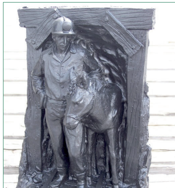
Kdysi byla tato oblast slavná těžbou uhlí, dnes tu z něj tvoří umělecká díla.

připadá divně, že musíme uhlí barvit, aby vypadalo jako uhlí, ale můžete mi věřit, celý proces výroby začíná u uhlí a jeho základem bylo a je uhlí,“ tvrdí Powell. Nejvíce prý vyrábějí sošky horníků, ale i postavy mardon nebo původních amerických osadníků, obvykle velikých kolem třiceti centimetrů. Jsou ale schopni vyrobit i malé ozdoby a magnety velké třeba jen pět centimetrů. Na přání zákazníka jsou prý schopni vyrobit prakticky cokoli i podle jeho návrhu. (red)