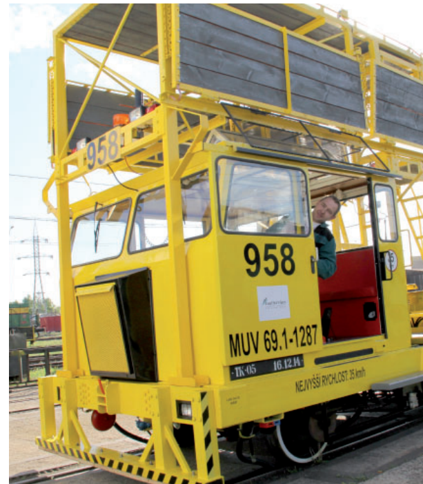
Drezínu po generální opravě budou využívat trolejáři.

nalo se o skutečnou generální opravu, při níž byly vyměněny všechny důležité části stroje, od kol, přes motor a převodovku až po vnitřek kabiny. Drezína dostala i zcela nový nátěr. Celkem se na pracích, které trvaly od ledna, podílelo šest zaměstnanců naší dílny,“ doplnil Karl. Generální opravy drezín nejsou hlavní náplní činnosti dílny ŽKV, proto probíhají pouze v době, kdy zdejší zaměstnanci nepracují na jiných zakázkách. Většinou se zde věnují opravám lokomotiv, ať už elektrických nebo dieselových a opravují i všechny druhy železničních vagonů, které se k přepravě uhlí i dalších materiálů v těžebních společnostech využívají. I přesto by rádi ještě během letošního roku jednu generální opravu drezíny stihli. Kolejová doprava Coal Services má celkem jedenáct drezín,