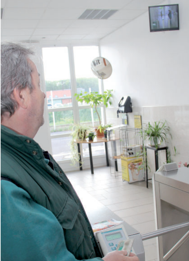
Bezpečnostní opatření při vstupu do areálu Vršanské uhelné byla rozšířena o monitority nad turnikety v hlavní vrátnici.