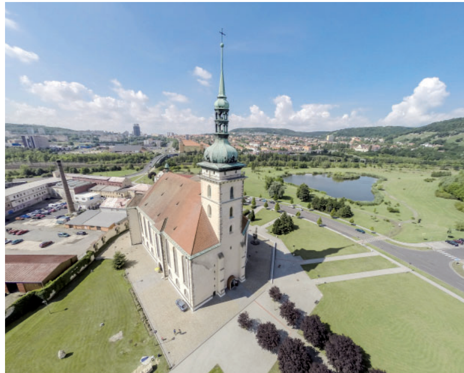
Kostel Nanebevzetí Panny Marie a jeho současné okolí.

Stěhování kostela v Mostě patří k nejslavnějším přesunům, není však ani jediný, dokonce ani první. Poprvé se historická památka v Československu stěhovala už roku 1956, tedy skoro dvacet let před mosteckým kostelem. Tehdy bylo třeba přesunout barokní kapli vlnařů pod pražskou Letnou, a to asi o tři-cet metrů proti proudu Vltavy.