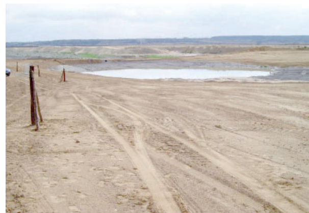
Takhle území vypadalo na začátku projektu v roce 2005.

„volnou ruku“. Po základních terénních úpravách, jejichž součástí byla i vodní plocha naplněná spodní vodou, se celý prostor nechal, laicky řečeno, ležet ladem, aby odborníci mohli sledovat, jak si příroda s dotčeným územím poradí. Nedělaly se zde žádné další výrazné zásahy, nevy-sazovaly se zde rostliny, vše