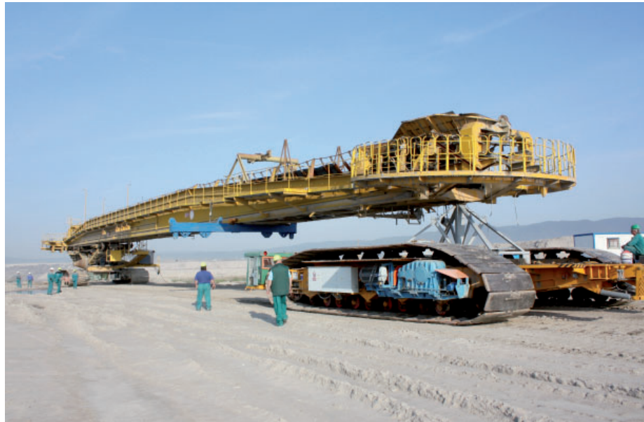
Před čtyřmi lety pomáhal transportní vůz převážet výložník na generální opravu velkostroje KU800.

Těžební technologie nejsou jen velkostí, ale i menší technika, která v těžebním provozu ulehčuje práci. Přesně takovým zařízením je třeba transportní vůz TV200M, který využívá úsek přestaveb a ostatních činností Vršanské uhelné.