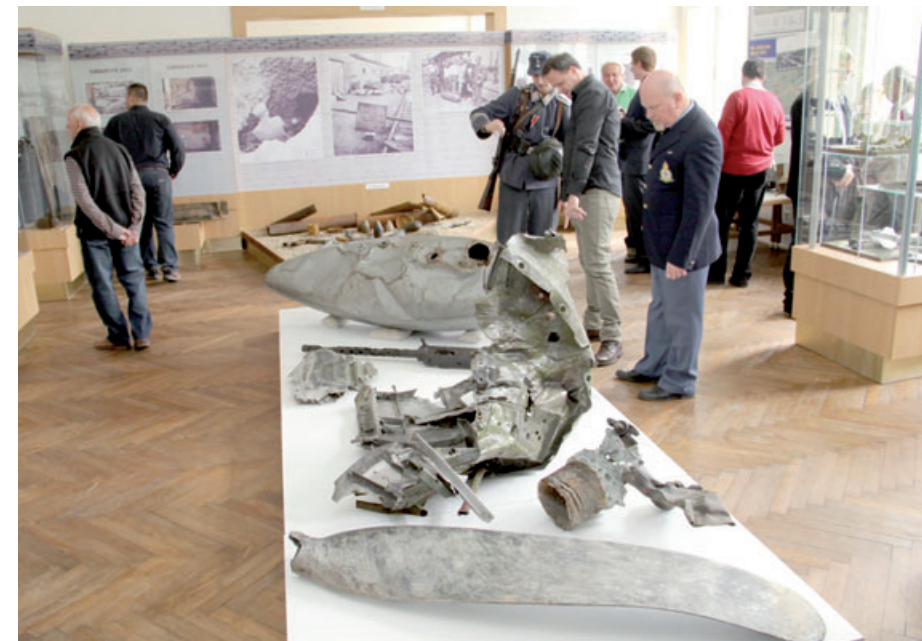
Součástí výstavy v mosteckém muzeu jsou i autentické části sestřelených letadel.

výjimečnou sbírku dobových artefaktů od věcí běžné denní potřeby, po vojenskou výzbroj. K vidění tu jsou části sestřelených spojeneckých letadel, ale také obří motor amerického letounu Republic P47 Thunderbolt. Součástí expozice jsou i unikátní fotografie a filmové záznamy. Specifikem mostecké výstavy je také fakt, že jednotlivé exponáty získalo muzeum nejen ze svých zdrojů, ale také od celé řady místních sdružení, spolků a soukromých sběratelů. (red)