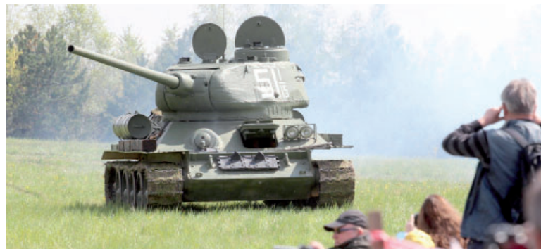
Slavilo se také u Jezera Most, kde jako součást oslav konce druhé světové války proběhla symbolická bitva mezi německou a ruskou armádou. Podle organizátorů šlo o čtvrtou největší akci tohoto typu na našem území.