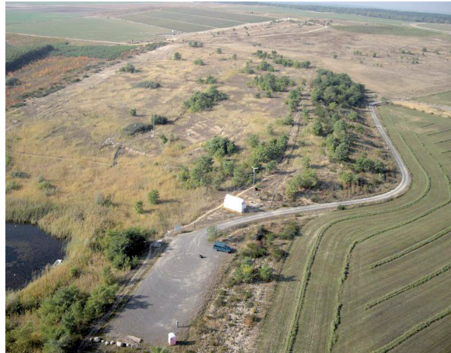
... a toto je Hühnerwasser v roce 2014.

Zatímco jezero Milada na Ústecku nedaleko Chabařovic už brzy budou moci využívat první návštěvníci, v jeho okolí stále ještě probíhají rekultivační práce. Krajina kolem bývalého Dolu 5. květen se během let změnila k nepoznání, dnes už se ale opět vrací k životu. Těžít se tu přestalo počátkem devadesátých let, mnohem dříve než se původně předpokládalo. Díky tomu se muselo přemýšlet i o nejideálnějším způsobu, jak krajinu rekultivovat. Poměrně dlouho se vedly diskuse, jak zahladit pozůstatky těžby a nakonec zvítězila takzvaná mokrá varianta, tedy zaplavení zbytkové jámy bývalého povrchového lomu. Na konci devadesátých let schválilo Ministerstvo životního prostředí plán rekulti-