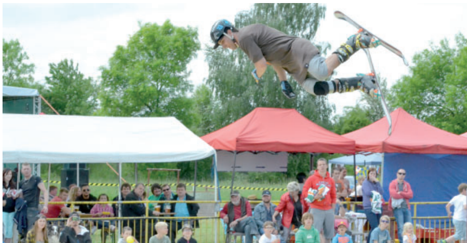
Trochu v předstihu slavili Den dětí v havraňském Jumparku. Zároveň připomněli mostecký titul Evropské město sportu 2015 a představili celou řadu sportů, které se na Mostecku nejen dětem nabízejí.

Málem by se dalo říct, že Mostecko a okolí celý květem proslavili. Důvodů bylo víc než dost. Výročí konce války, úspěchy sportovců nebo první oslavy svátku dětí. Možná zapůsobilo příjemné jarní počasí, ale na místech, kde se jednotlivé akce konaly, se sešla spousta lidí. U jezera Most, kde si konec druhé světové války připomínali ukázkovou bitvou, bylo podle odhadů na patnáct tisíc lidí a šlo prý o jednu z největších akcí tohoto druhu v Česku. Už potřetí slavily mistrovský titul házenkářky Černých andělů a opět u toho byla plná sportovní hala. Není divu, že soupeřky závidí mosteckým házenkářkám tak skvělou diváckou kulisu.