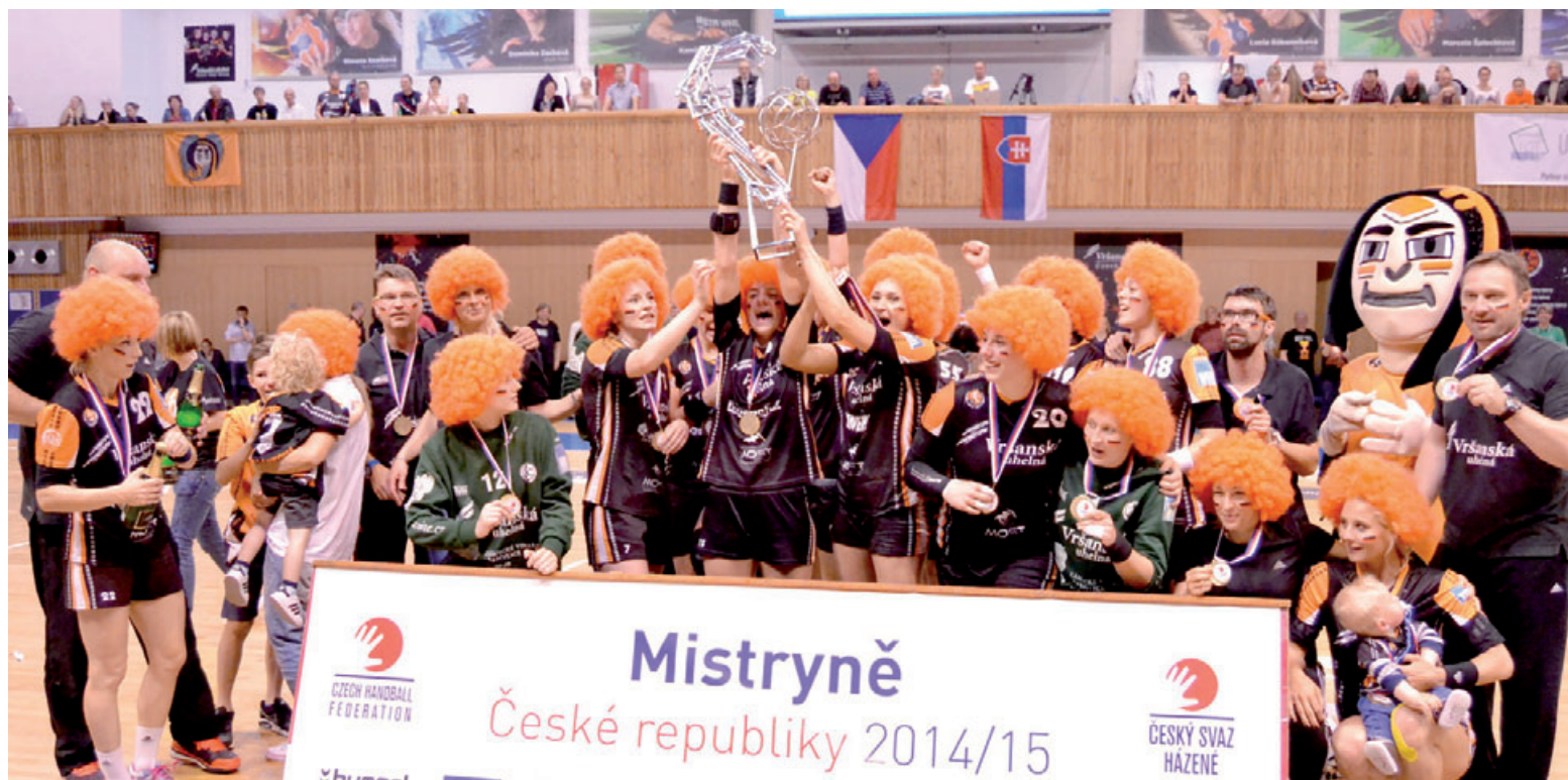
Důvod k oslavám měly mostecké házenkářky, už potřetí mohou slavit mistrovský titul. Ve finále sice v prvním zápase s Porubou prohrály, ale na domácí půdě své soupeřky ve dvou zápasech naprosto přesvědčivě porazily. Po zisku Českého poháru je to druhý významný úspěch mostecké ženské házené, kterou podporuje Vršanská uhelná.