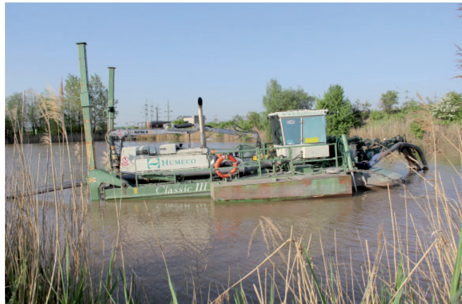
Sací vodní bagr čistil ve Vršanech usazovací nádrž úpravní důlních vod.

se tu během let nashromáždilo,“ uvedl hlavní inženýr Humeco Petr Sigmund. Sací bagr pracoval na lokalitě Vršany dva měsíce, během nichž odčerpá z nádrže přibližně 30 tisíc kubíků vody s obsahem nečistot zhruba čtyři kusy jedné. (red)