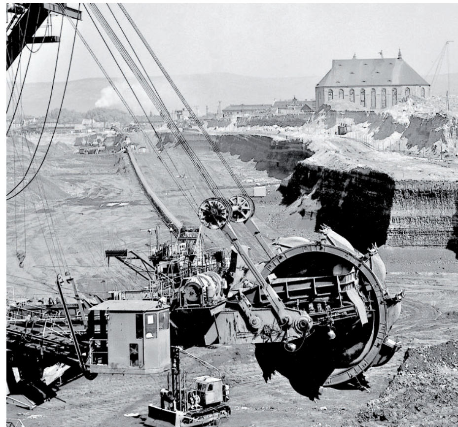
Těžba na dosah od kostela, po které následovalo jeho unikátní stěhování.