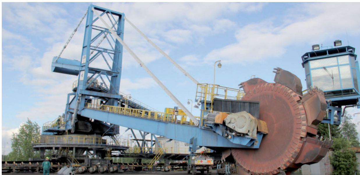
Skládkový stroj USSK 3 má pololetní revizi za sebou. Obdobný velkstroj, který ho během deseti dnů zastupil, se na odstávku chystá.