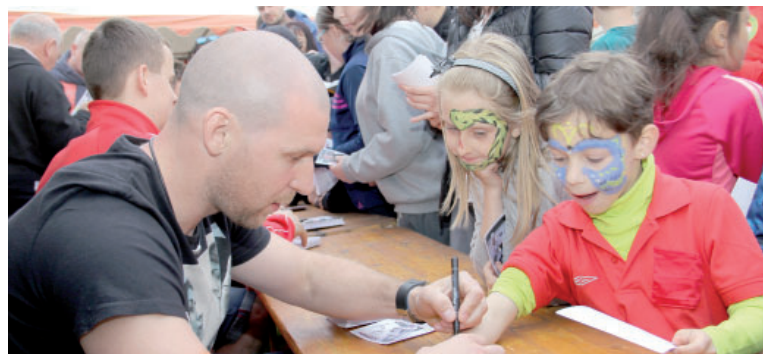
Zahájení deváté sezony ve strupčickém sportovním areálu byla také trochu oslava. Letos ho totiž otvírali hokejisté Pirátů Chomutov, kteří slaví postup do extraligy.