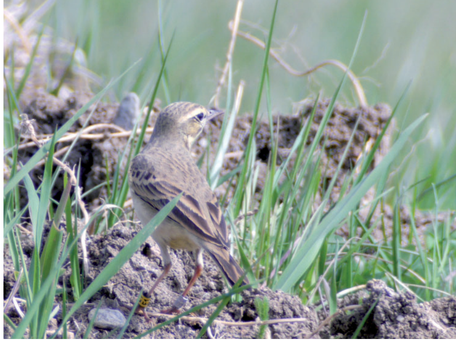
Linduška úhorní je drobný pták podobný vrabci.

V celé Evropě žije kolem milionu párů těchto ptáků, ovšem většina na jihu. V sousedním Německu populace lindušek rychle mizí, v Dánsku evidují posledních několik párů. „S trochou nadsázky by se tak dalo říct, že lindušky u nás přežívají hlavně díky šachtám, které jsou pro ornitology téměř rájem na zemi,“ dodal Václav Beran. Přímou potřebou projektu bylo ve Vršanské uhelné vyčleněno zhruba 110 hektarů plochy, na nichž se chová ptáků sleduje. „Vlastně jde o unikátní přírodní laboratoř, protože není snadné najít tak rozsáhlé území, které po dobu čtyř let zůstane nedotčené,“ doplnil Beran. V rámci projektu se ale snaží sledovat celý prostor Vršan, stejně jako ostatních šachet v kraji, aby informace o chování ptáků byly komplexní. „Nejdříve musíme samozřejmě zjistit, kde přesně ptáci žijí, pak je kroužkujeme, hledáme hnízda, abychom mohli označit mladé. Kromě toho vybraným ptákům dáváme, lidově řečeno, batůžky, neboli geolokátory, díky nimž