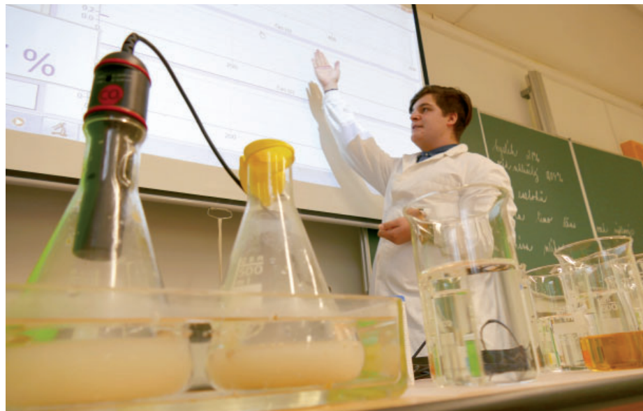
Nová učebna přírodovědných předmětů slouží studentům na zdravotnické škole.

„Letos jsme se do Chytrých hlav přihlásili s projektem na modernizaci učeben přírodovědných předmětů na zdravotnické škole, kde s nimi studenti přicházejí do styku nejčastěji a pro mnohé z nich jsou i předměty maturitními. Učebnu jsme chtěli