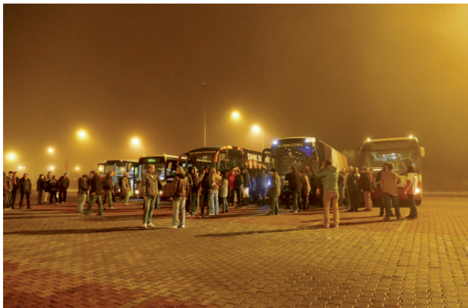
Na demonstraci v Ústí nad Labem vyrážely autobusy z Mostu ještě za tmy a zahalené do mlhy.

Jedenáct autobusů s horníky vyrazilo v pondělí 19. října před krajský úřad do Ústí nad Labem, aby tady před výjezdním zasedáním vlády ČR dali jasně najevo svůj názor na problematiku pokračování těžby na severu Čech. Šest stovek demonstrantů nejen z Mostecka, ale i ze Sokolova a Ostravy chtělo vyjádřit svůj nesouhlas s chováním vlády premiéra Sobotky, která podle jejich názoru likviduje těžební průmysl, hazarduje s nerostným bohatstvím i osudem horníků a jejich rodin. Vláda nakonec podpořila pouze prolomení limitů těžby uhlí na lomu Bílina, o budoucnosti těžby v lokalitě ČSA se nakonec nerozhodlo. Ministři schválili, že o případném pokračování těžby na Mostecku rozhodnou až poté, co budou vědět, zda bude stát zdejší uhlí skutečně potřebovat.