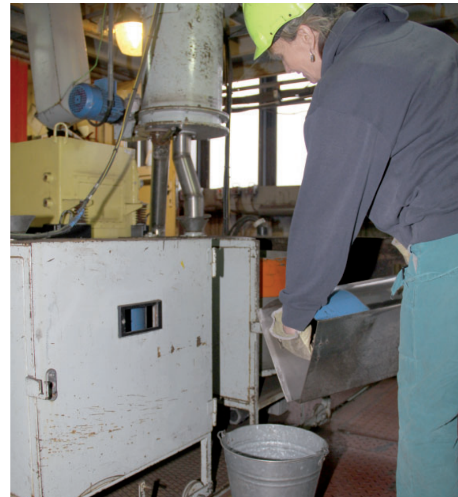
Kvartovač, neboli kolotoč, vzorek rozdělí, vzorkařka ho ale musí připravit k dalšímu zpracování.

Protože vzorkování probíhá čtyřadvacet hodin, pracují i vzorkařky v nepřetržitém provozu na směny. Jejich denní režim je poměrně nabitý. Po ranním příchodu do vzorkovny, která se nachází v nakládacím zásobníku v lokalitě Hrabák, je třeba nejprve „uzavřít“ vzorek z předchozího dne a následně začíná celý kolotoč činností, které musí za směnu stihnout. Na prvním místě je „zalogování“ se do počítače, protože veškeré kroky, které se týkají vzorkování, jsou evidované. Následně z odebraný vzorek informace o denní nakládce a potom zadá „rodné číslo“ (tzv. SVC - samostatně vzorkovaný celek) k novému vzorku pro další dodávku. „Neustále je přítom v kontaktu s nakládkou a výrobou. Komunikace s dispečerem je také jednou z důležitých činností, protože vzorkaři jsou vlastně také tak trochu očima a prodlouženými rukama výrobních dispečerů,“ připomněl vedoucí laboratoří. Řada činností je dnes řízena počítačově, vzorkovna je sítí propojena s laboratoří, ale také dispečeri mají na monitorech informace z popeloměrů umístěných v nakládacím zásobníku. Neméně důležitou součástí práce je i kontrola technologie, jinak řečeno, zda všechna zařízení, i když pracují v automatickém režimu, pracují