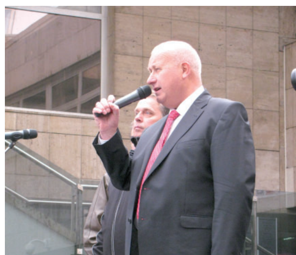
Účastníky hornické demonstrace podpořil i hejtmán Ústeckého kraje Oldřich Bubeníček.