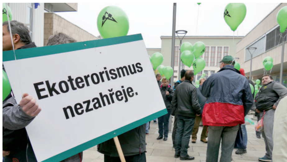
Cílem shromáždění bylo dát vládě jasně najevo názor horníků na její kroky kolem pokračování těžby na severu Čech.