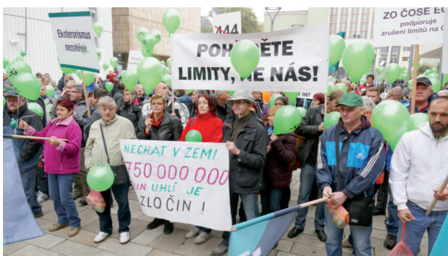
Hlas několika stovek demonstrantů pod okny krajského úřadu nakonec vláda nevyslyšela a o osudu lokality ČSA nerozhodla.