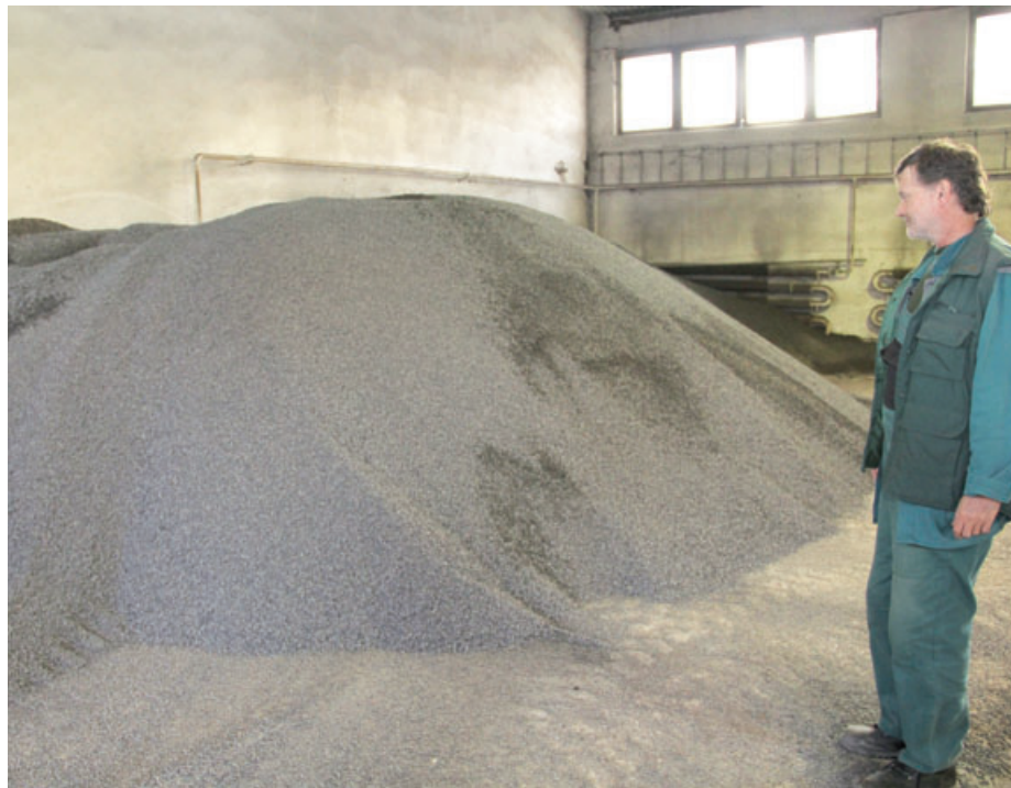
Czech Coal Power má ve skladu na lokalitě Hrabák už zhruba 60 tun šterku a přibližně stejné množství soli.

Podle kalendáře sice začíná zima až v prosinci, ve Vršanské uhelné ale byla zahájena příprava na zimní režim již nyní.