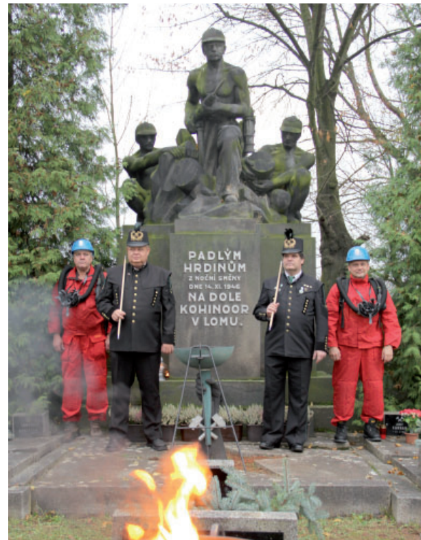
Neštěstí na Kohinooru připomíná památník na lomsčím hřbitově.

nikomu, kdo se nacházel v zasaženém prostoru, nepodařilo uniknout. Většina obětí se otrávila zplodinami, protože výbuch vmžiku spotřeboval veškerý kyslík v ovzduší a spálil jej na velké množství jedovatého CO. Vše se odehrálo tak rychle, že ačkoliv první záchranáři na místo neštěstí dorazili jen patnáct minut po tragédii, nikoho živého už nenašli. Z 52 obětí havárie na Kohinooru bylo 38 kmenových zaměstnanců dolu, 7 válečných zajatců a 7 trestanců z nápravného zařízení v nedalekých Libkovicích. Pohřeb obětí se všemi poctami na pracoviště revíru. Výbuch se konal 19. listopadu 1946 za účasti tehdejšího předsedy vlády Klementa Gottwalda i dalších nejvyšších představitelů státu. Na hřbitově v Lomu jsou uloženy ostatky 28 obětí, neštěstí zde připomíná pomník, kde se každoročně koná pietní akt. Nejvyšší soud v Brně svým rozsudkem z roku 1949 vyloučil jakékoliv zavinění ze strany závodu, dlouhá léta ale se ale k veřejnosti nedostaly všechny informace o tragédii. Důvodem byla skutečnost, že mezi oběti byli váleční zajatci a také trestanci - kolaboranti z nápravného tábora v Libkovicích. Podle dochovaných pramenů neměly při vyřizování odškodnění žádný nárok rodiny postižených, které byly odsunuty do Německa, stejně tak osoby, které se nemohly prokázat osvědčením o státní spolehlivosti. Havárie na Kohinooru je druhou největší důlní katastrofou na Mostecku. Nejvíce obětí, celkem 65 lidských životů, si vyžádalo neštěstí na dole Pluto v Louce v září roku 1981. (red)