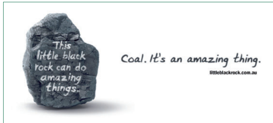
Tenhle malý černý kámen umí dělat úžasné věci, tvrdí kampaň.

Uhlí je úžasné, je ústředním sloganem kampaně, kterou v září spustila Asociace australských těžebních organizací (Minerals Council of Australia - MCA). V rozhlase, televizi i v novinách chce veřejnost přesvědčit o nezbytnosti těžby uhlí v Austrálii.