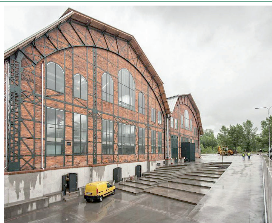
Trojhalí v Ostravě přitahuje milovníky sportu a kultury.

dnes chráněnou kulturní památkou, která ale po rozsáhlé revitalizaci dostala nové využití. Původně zde byly stroje a turbíny, dnes sem přicházejí lidé za sportem, kulturou a dalšími možnostmi, jak příjemně strávit volný čas. Dvojhalí, neboli objekt bývalé elektrocentrály je jakýmsi zastřešeným náměstím, kde se pořádají koncerty, výstavy, divadelní představení, trhy, veřejné bruslení i různé další společenské, kulturní a sportovní akce. Ústředna je samostatnou budovou, která slouží především sportu. Sportovci tu mají k dispozici dvě tělocvičny k ryze sportovním aktivitám, ať už jde o volejbal, badminton, basketbal nebo florbal, včetně veškerého vybavení. Trojhalí bylo po rekonstrukci otevřeno v červenci 2014. (red)