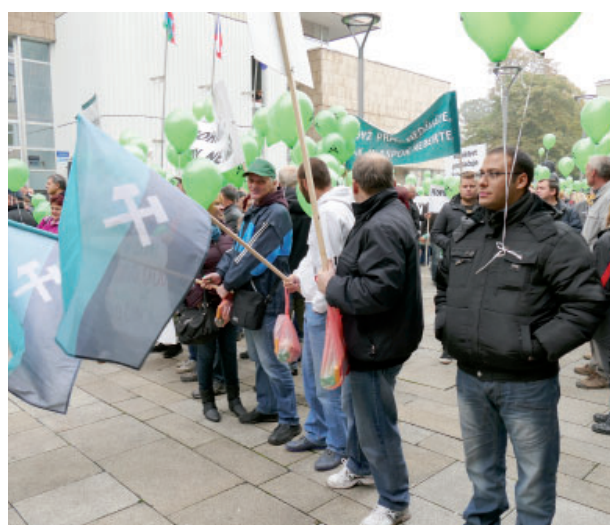
Protest před krajským úřadem sice organizovali horníci, ale podpořili jej i další profesní organizace, obce i někteří občané.