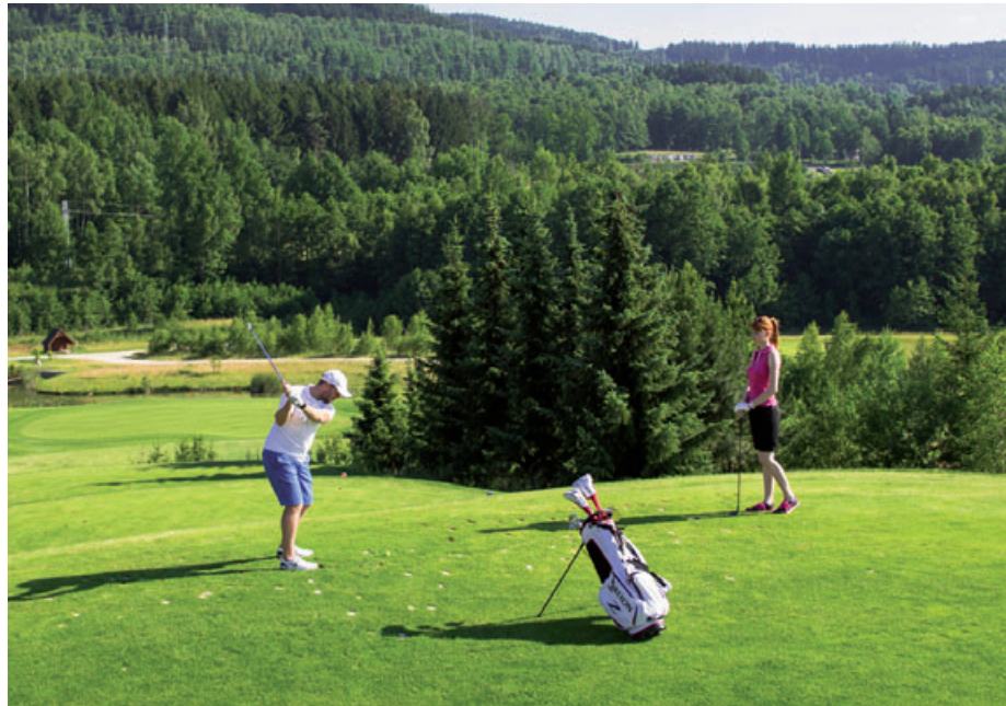
Golfový areál v Sokolově vznikl rovněž jako výsledek rekultivace po těžební činnosti.

ku 20. století tu stála vesnice Horní Rychnov, která začala mizet v roce 1939, kdy byl otevřen důl Silvestr a vytěženo první uhlí. Těžební činnost na Silvestru byla ukončena v roce 1981. Rozsáhlý areál mezi Sokolovem a Dolním Rychnovem prošel rekultivací, ale jeho jediným dalším využitím bylo umístění sportovní střelnice na jižním okraji plochy. „Myšlenka na revitalizaci dolových území a jejich nové využití se objevila v polovině 90. let. V roce 2001 pak Sokolovská uhelná vypsala výběrové řízení na vybudování golfového hřiště,“ uvedla Štěpánková s tím, že soutěže se zúčastnil i německý archi-