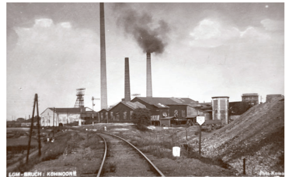
Historická pohlednice Dolu Kohinoor II.

Dne 21. května 1944 se důl Kohinoor zapsal do válečných dějin, když se ve 13:35 stal terčem vůbec prvního útoku hloubkařů, tedy amerických stíhacích letců, na území bývalého Československa. Piloti svým ostřelováním měli poškodit potrubí, elektrickou centrálu, kotelnu, těžní stroj a chladicí věž. Stalo se tak v den, kdy byla spuštěna operace Chattanooga, která byla jakožto součást spojenecké přípravy na vylodění v Normandii zaměřena na ochromení železniční dopravy v Německu. K neštěstí došlo na Kohinooru 6. dubna 1944. Toho dne byl houkán letecký poplach a jako ve většině těchto případů sfáraly do šachty také ženy s dětmi, aby se ukryly před případným bombardováním, které celé Mostecko zažilo v průběhu II. světové války sedmkrát. Naneštěstí v podzemí došlo k požáru ve spojovací chodbě. Hustý dým se rozšířil až k jámě a v následném zmatku v hlubinně zahynulo sedm lidí. O události se krátce zmiňuje zápis v kronice dolu. Zmatek a paniku měli údajně způsobit ruští zajatci, kteří za II. světové války na dole pracovali. (eš)