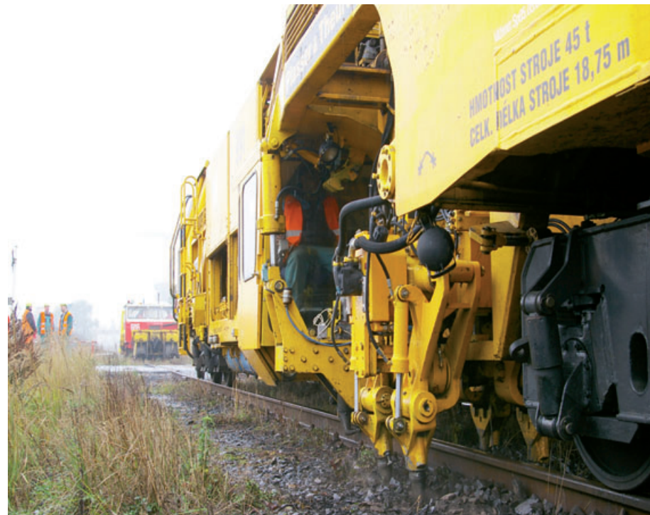
V horní části podbiječky koleje nejprve proměří a podle těchto údajů pak pracuje obsluha hydraulického zařízení.

trvalo mnohem déle. Díky speciálním nástavcům může čistit nejen přímo v trati, ale i ve výhybce,“ doplnil Drtil. Obsluhu stroje přítom zajišťuje jediný člověk za dozoru některého z dalších kolegů úseku. Podobnou specialitou je podbiječka kolejí. I ta má svůj původ v zahraničí, ve firmě Plasser & Theuer ji vyrobili v roce 1985. Jejím úkolem je upravit směrovou a výškovou polohu koleje, laicky řečeno, upravit koleje tak, aby se „nekrotily“. Proto je její obsluha poněkud složitější. V horní části stroje sedí obsluha, která kolej nejprve proměří a získané parametry předá do spodní části podbiječky dvěma kolegům. Ti obsluhují hydraulické zařízení, které na základě získaných parametrů na principu vibrace kolej „podbíjí“. „Speciálníou tohoto stroje s desativálovým spalovacím motorem je mimo jiné fakt, že je chlazen