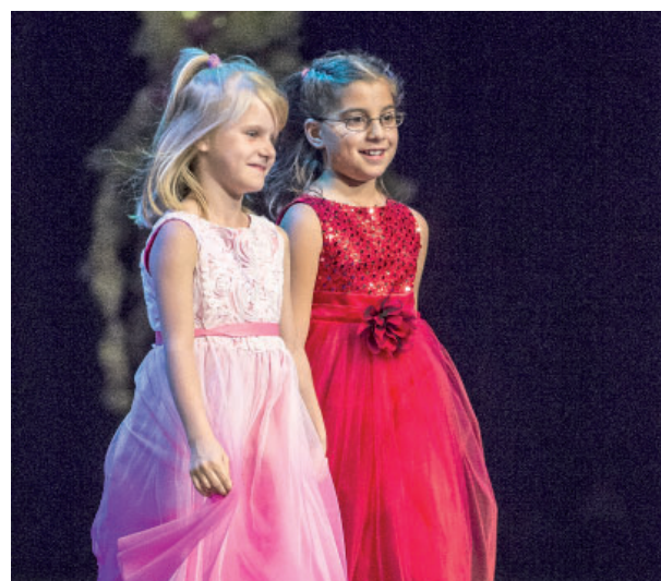
Na přehlídkách svatebního salonu Delta bývají často modelkami holčičky a dívky z dětského domova a Klokánku.