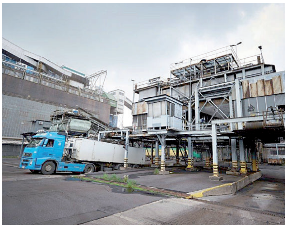
Severní energetická nabízí spotřebitelům speciální druh tříděného uhlí.

Nově připravený druh pecka je svou velikostí a vlastnostmi velmi podobný uhlí dodávanému z Polska, je ale minimálně o čtvrtinu výhřevnější. Cenový rozdíl je přitom řádově v desítkách korun. Může být tedy řešením pro seniory i sociálně slabší odběratele. Je ho však k dispozici jen omezené množství. Vagóny s mosteckým uhlím je Severní energetická připravena dodat prostřednictvím svých autorizovaných prodejců. Navíc je schopna pokrýt zájem v ohrožených obcích dlouhodobě. Výpadek dodávek z Polska totiž prodejci odhadují na půl roku až rok. (red)