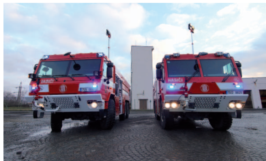
Nejnovější tatry hasičů Severní energetické budou nasazovány v obou těžebních společnostech skupiny Sevens Energy.

bavení, například v přední části na nárazníku otočnou proudnici, která se ovládá z kabiny řidiče nebo elektrocentrálu s osvětlovacím stozářem. „Výbavu obou vozů jsme rozšířili i o další osvědčené a v těžebních lokalitách používané prostředky,“ doplnil Jiří Polívka, vedoucí strojní služby hasičského záchraného sboru Severní energetické s tím, že auta budou nasazována na obou těžebních lokalitách skupiny Sevens Energy, v Centrální požární stanici Obránců míru a pobočné požární stanici Hrabák.