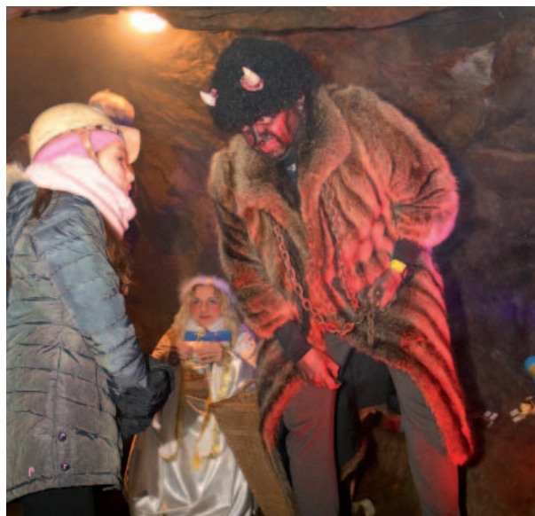
Do štol Marie Pomocná na Měděnci se za Mikulášem a čerty vypravila zhruba stovka návštěvníků.

řejnost v Rakousko - Uhersku, pro turisty ji otevřeli už v červnu 1911. Delší čas nevyužívanou štolu získal před nedávnem mostecký Spolek severočeských havířů, který ji v roce 2017 pomáhal znovu otevřít pro veřejnost a postupně ji předal spřátelenému spolku, se kterým velmi úzce spolupracuje a pořádá hornické akce. Hornický region Erzgebirge/Krušnohoří zapsaný na seznam UNESCO zahrnuje 22 krajinných útvarů. Pět se nachází na české straně Krušnohoří, sedmáct v sousedním Sasku. Českou část reprezentují Hornická krajina Jáchymov, Hornická krajina Abertamy – Boží Dar – Horní Blatná, Rudá věž smrti ve Vymanově, Hornická krajina Krupka a Hornická krajina Mědník.