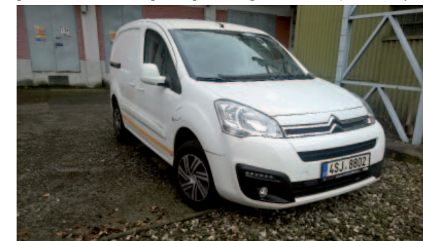
Dvojice vozů Citroen Berlingo Furgon SX Electra úspěšně slouží údržbě tepláren v Kladně a Zlíně.

řídili dva užitkové elektromobily Citroen Berlingo Furgon SX Electra. Oba už úspěšně od října 2018 slouží pracovníkům údržby jak v kladenské, tak zlínské teplárně. Tento projekt je spolufinancován Evropskou unií - Evropským fondem pro regionální rozvoj. (mč)