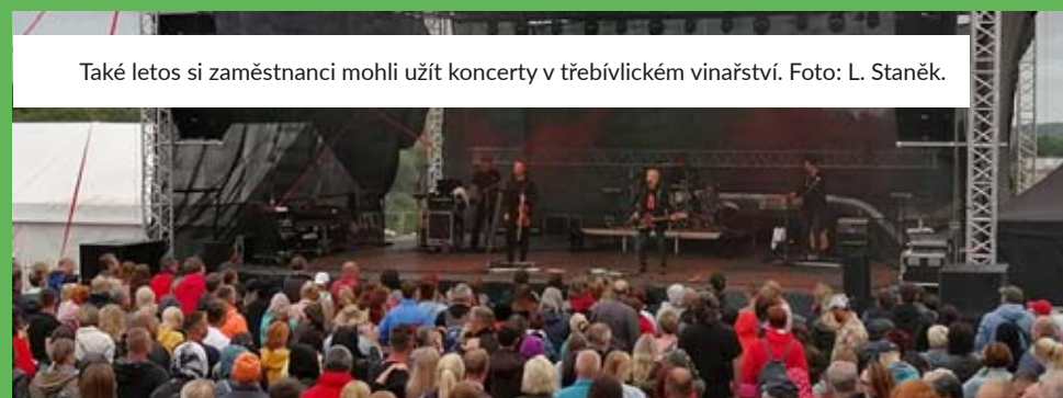
Také letos si zaměstnanci mohli užít koncerty v třebívlickém vinařství.