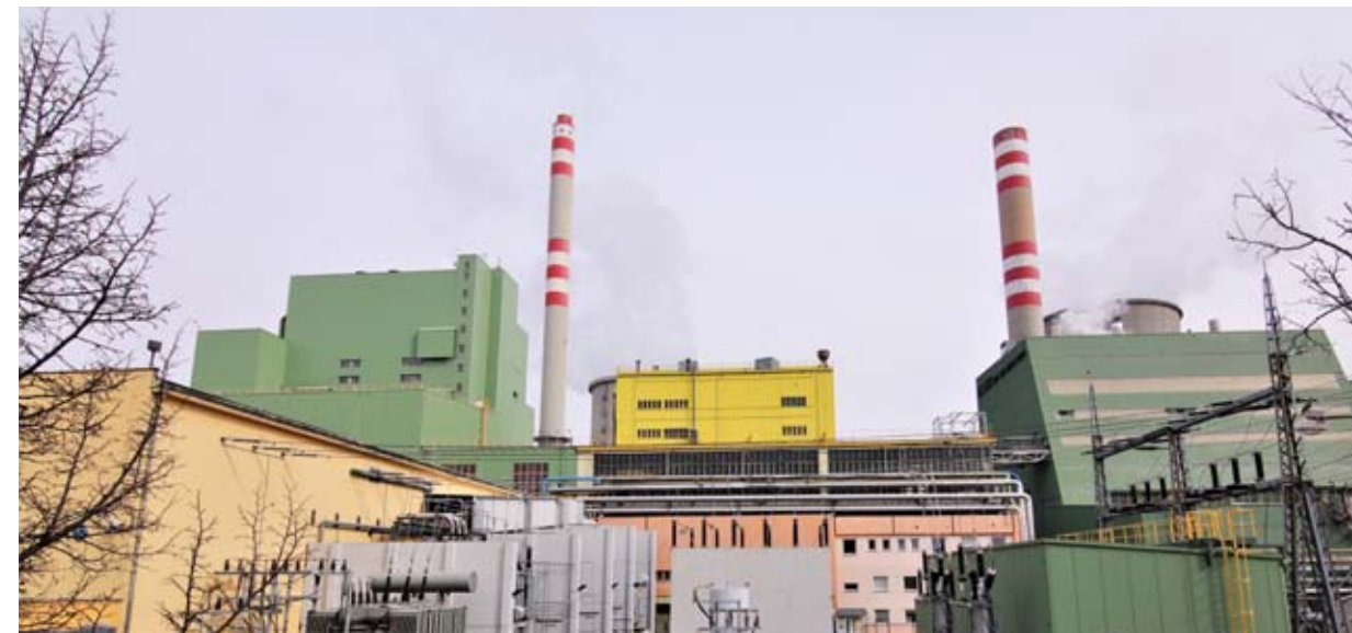
Teplárna Kladno.

Dodávek tepla a teplé vody od Teplárny Kladno využívá více než dvacet tisíc kladenských domácností. Vyjma domácností zajišťuje centrální zdroj tepla v Kladně dodávky tepla také pro veřejné budovy jako školy, krajskou nemocnici, domov pro seniory. Ve Zlíně se teplo pro sedmáct tisíc domácností, úřady, školy, nemocnici a další odběratele vyrábí z domácího hnědého uhlí a biomasy. Ke konečným odběratelům ho distribuuje také prostřednictvím městské společnosti Teplo Zlín a.s. (red)