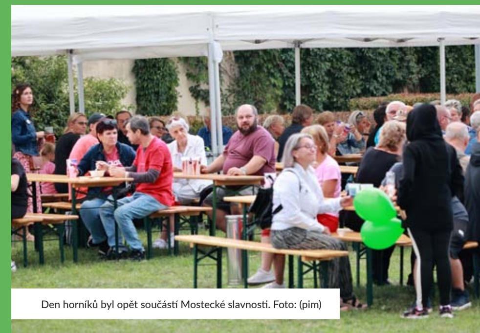
Den horníků byl opět součástí Mostecké slavnosti.