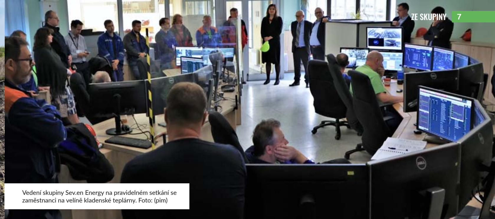
Vedení skupiny Sev.en Energy na pravidelném setkání se zaměstnanci na velině kladenské teplárny.